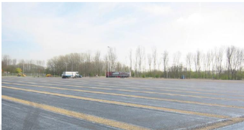
Foto: Aanleg vloeistofdichte asfaltconstructie.

Voor betonreparaties geldt NEN-EN 1504 deel 1 t/m 10 [14]. Hoofdstuk 7 van CUR/PBV-Aanbeveling 65 is niet van toepassing.